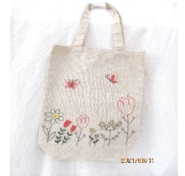
まんげきょう・小物入れ・エコバッグ